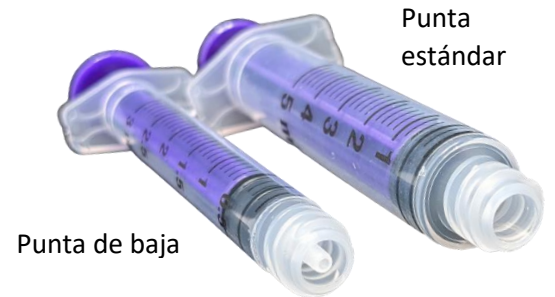
Jeringa Enteral ENFit