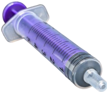
Jeringa Enteral (Tradicional)