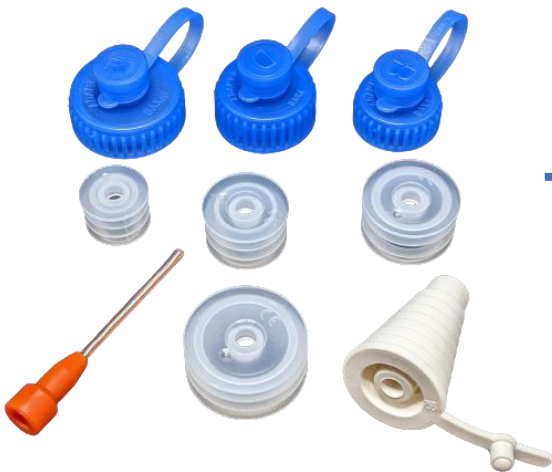
Accesorios De Farmacia Heredados